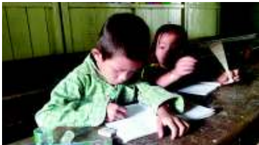
勉強をする子供たち

1か月半ぶりに帰ってきたら、教会の学校に通ってくる子供たちの数が減っていました。先生は「今は漁が忙しい時期なので、手伝いのため来られない。また、今年はベトナムへの移住を考えている人が多い。移住するならクメール語の学習は必要なくなり、学校に来る子どもが減っている」と言っていました。今は乾期で大規模な漁が解禁になり、人手が必要になります。子供が学校に行かず、家の仕事を手伝う家庭が多いです。