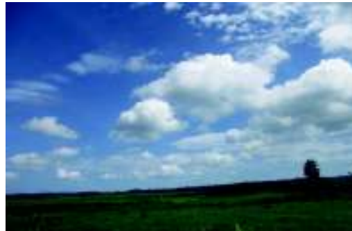
ロスパロスの大自然

でビザのことで一時帰国を余儀なくされましたが、味の素事業の調整、実施、「AFMET」の今後の活動についての話し合いなど、こうして振り返ってみると、本当にバタバタな7年4か月だったなあ、でも、こんなに充実した7年間はきっともう二度と訪れないだろうなあとも感じています。