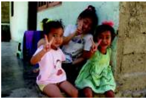
私のことを「白いお姉さん」と呼ぶ子供たち

～、全部無くなってゼロになって、やっとティモール人の暮らしがわかるじゃない！まだこれからよ！頑張れ～!!」。母が言ってくれたこの言葉を、私はきっと一生忘れないと思います。「帰って来なさい！」ではなく、「必要とされなくなるまでそっちで働きなさい」と、いつも背中を押してくれた母。本当はたくさん思うところがあったらうに、何も言わず、黙って私の進む道を支えてくれた父。家族の支えがあってこそ過ごせた東ティモール滞在でした。