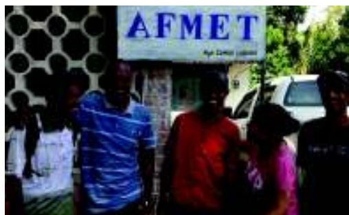
お世話になった AFMET スタッフたちと

2018年4月9日、今30歳の私は、東ティモールが大好きで、最後まで頑張った自分に「がんばったね」と素直に言えるようになりました。これからもきっと、ずっと、東ティモールのことは忘れません。共に笑い、時に喧嘩し、共に過ごした貴重な日々。歴史も文化も、何もかもが違う東ティモールで、現地の人々と家族のように繋がり、成長させてもらい、助けてもらい、なによりも、共に生きてもらいました。いつもあったかくて、一緒に泣いてくれて、話を聞いてくれて、支えてくれて。かけがえのない7年4か月。これまで出会ったすべての東ティモール人に、心からの感謝を！！