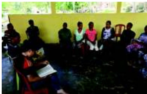
事業受益者との会議の様子

なことやツライこともたくさん、挙げだしたらキリがないほど。でもそんなとき、あハハと笑ってみると、見え方違ってきたり。1人が笑うと皆も笑い出して、笑顔になれます。これは、日本に帰ってからも、続けていこうと思っています。