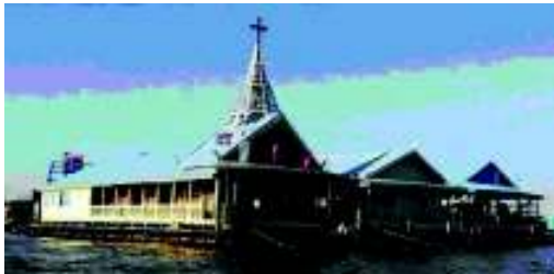
建物が流されないために多くの碇とロープが必要

まったりして損傷します。碇は大きいものは40kg、そのため定期的な交換が必要です。